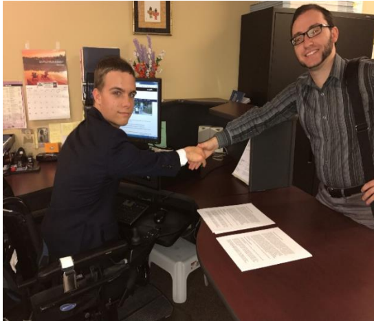
Figure 4. Accessibilité à l'emploi