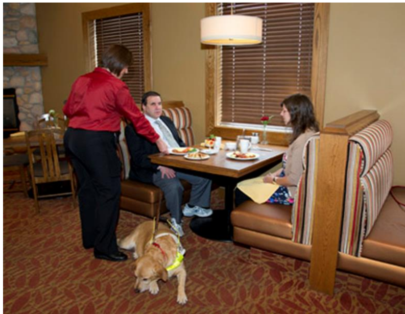
Figure 2. Service à la clientèle accessible