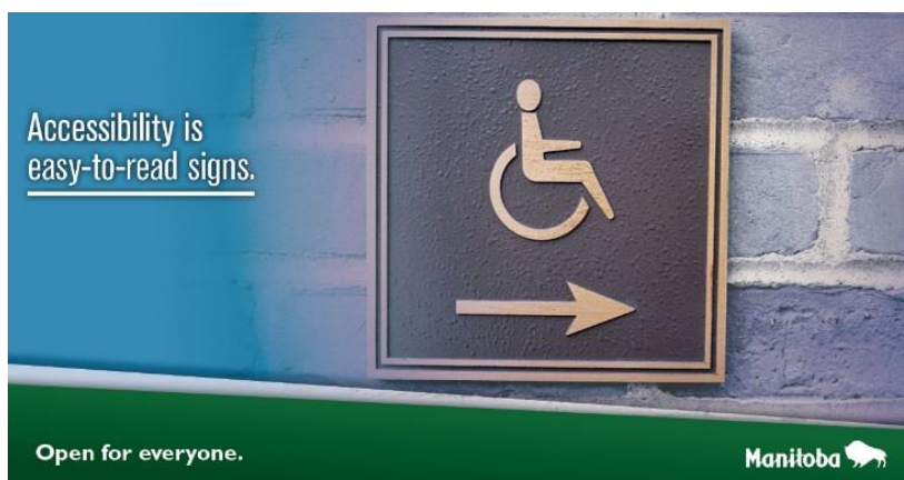
Figure 5. Sensibilisation à l'accessibilité

L'adoption d'une stratégie de communication triennale a également permis de sensibiliser la population à l'importance de l'accessibilité. Cette stratégie comprenait une campagne de publicité qui a été diffusée sur des plateformes de médias sociaux populaires. Ces publicités ont permis de communiquer des messages simples transmis dans un langage clair (voir l'exemple montré à la figure 5 ci-dessous).