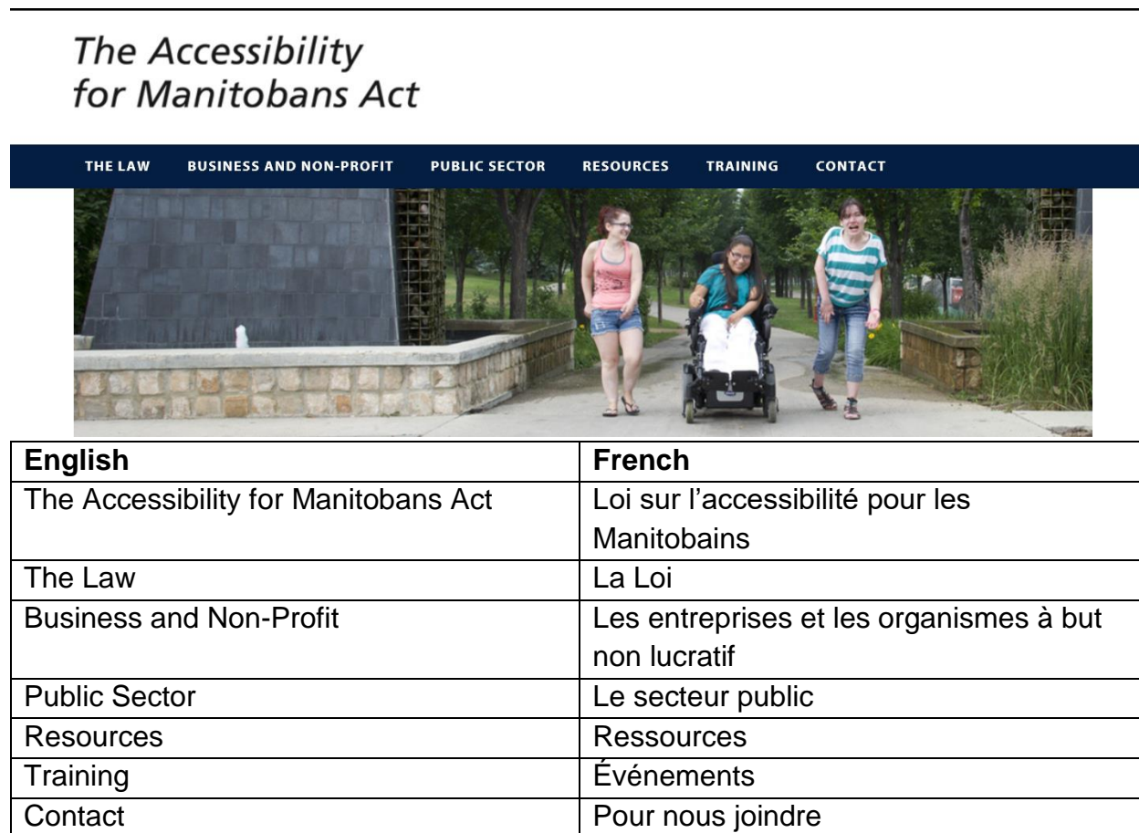
Figure 6. Outils d'accessibilité en ligne, ressources et formation