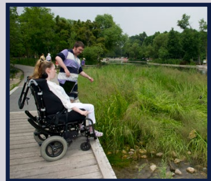
Conception des espaces publics extérieurs