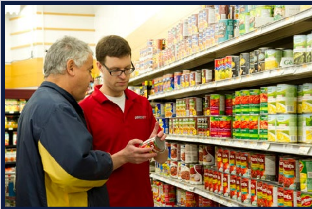
Service à la clientèle