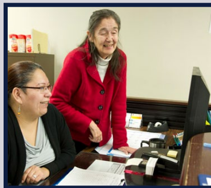
Renseignements et communication